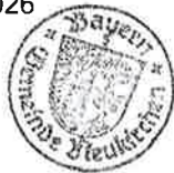
Matthias Wallner Erster Bürgermeister