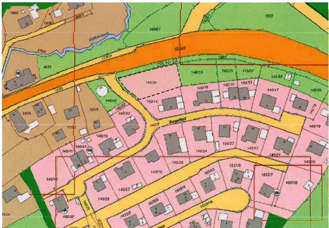
Änderung Flächennutzungsplan durch Deckblatt Nr.24